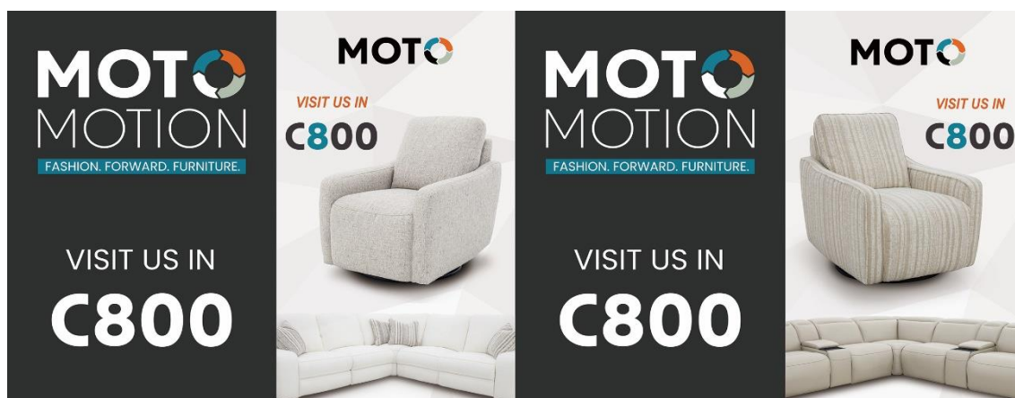
MOTOMOTION 2023 年 10 月匠心在美国高点展览会的主会场所做的户外广告 FASHION. FORWARD. FURNITURE.